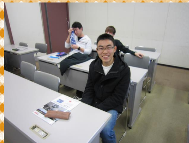
発表前の緊張の面持ち